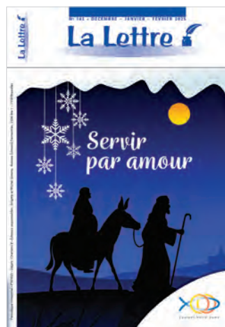
No 145 • Décembre – Janvier – Février 2025

Nous rappelons aux lecteurs que seuls les articles signés de l'ESRB et de l'ERI expriment la position actuelle du mouvement des END. Les autres articles sont proposés comme matière de réflexion dans le respect d'une diversité fraternelle. La rédaction se réserve le droit de condenser ou de réduire les contributions envoyées en fonction des impératifs de mise en page.